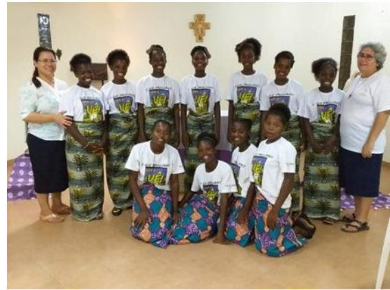
TODAS AS FORMANDAS DE CALOMBOLOCA COM AS IRMÃS