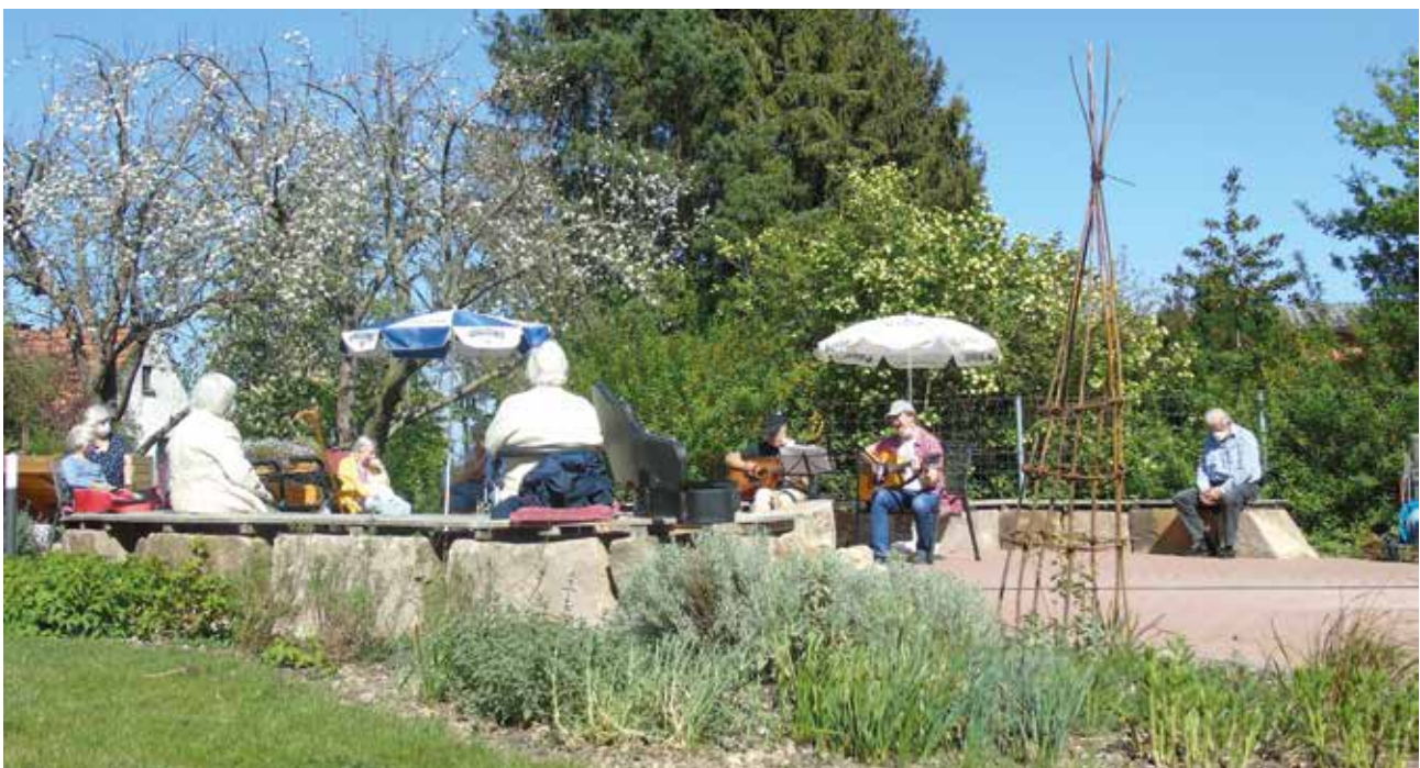
Einblick in die „Open-Air-Arena“ im Garten. „With 4 Hands“ in Gesellschaft einiger weniger Bewohner unter Berücksichtigung aller gebotenen Vorsichtsmaßnahmen.