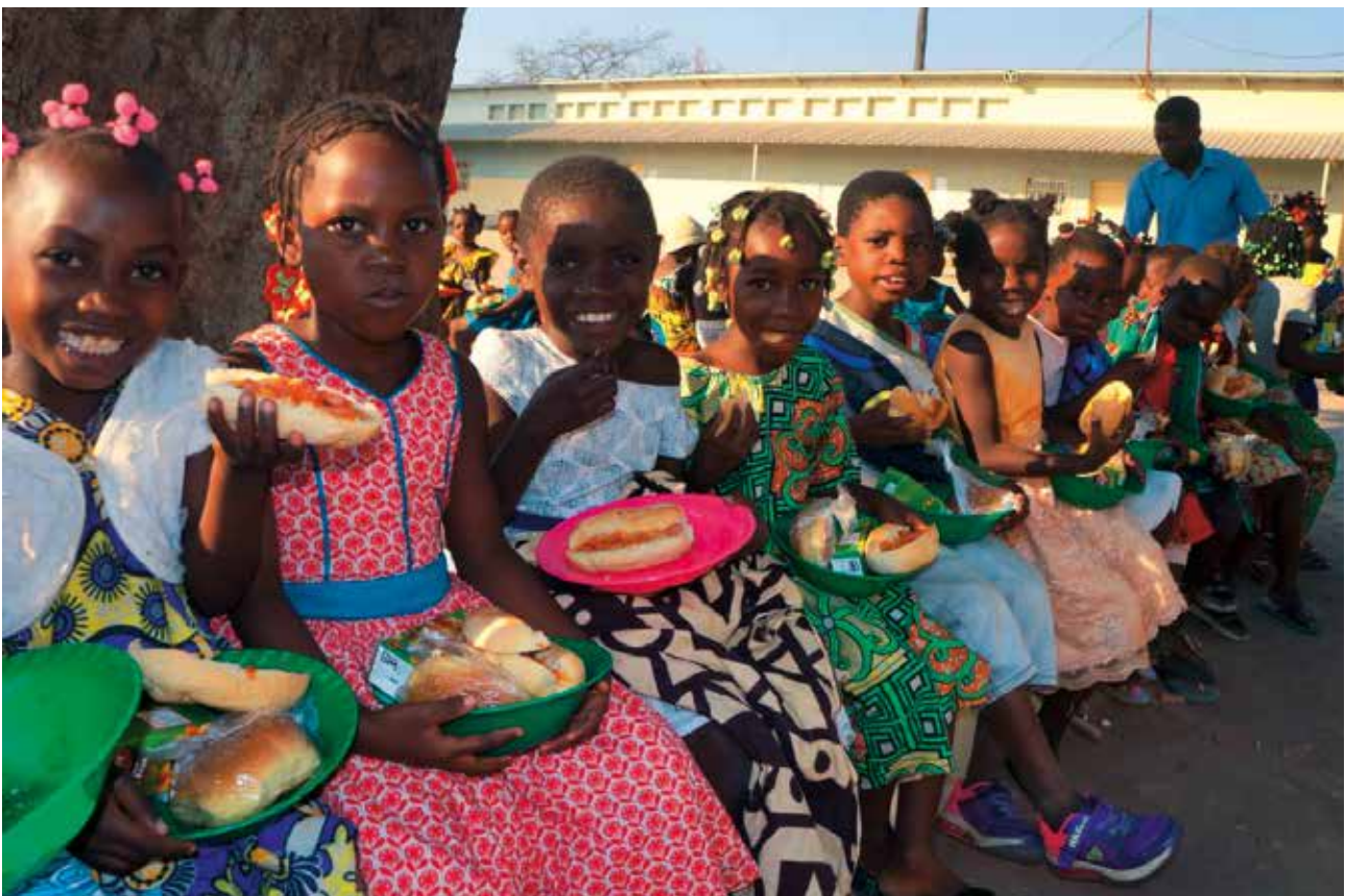
Schulkinder in Kangandala