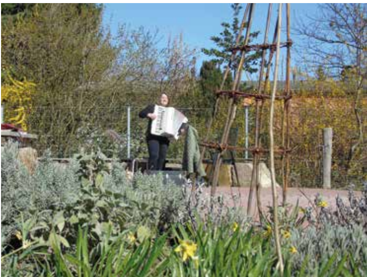
Sonnige Frühlingsstimmung im Garten. Hier fanden besonders die Seemannslieder großes Gefallen.

Sie ging Lied für Lied immer ein kleines Stück weiter die Klosterstraße herunter, um eine Zeit lang vor den jeweils geöffneten Fenstern zu spielen.