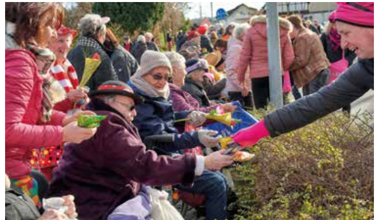
Strassenkarneval mit großer Begeisterung. Wetterfest ausgerüstet treffen die Bewohner am Treffpunkt ein. Die Zugteilnehmer schenken den Bewohnern Kamelle, Blumen und Stofftiere.

Am Veilchendienstag endet die närrische Zeit in Aegidienberg mit dem „Veedelszoch“. Der Straßenkarneval bereitet Bewohnern und Mitarbeitern jedes Jahr aufs Neue große Freude.