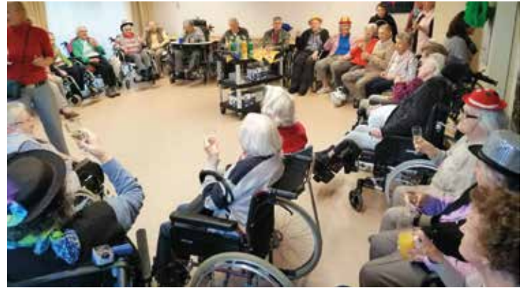
Große schunkelnde Runde beim ersten Tanzcafé im Christinenstift.