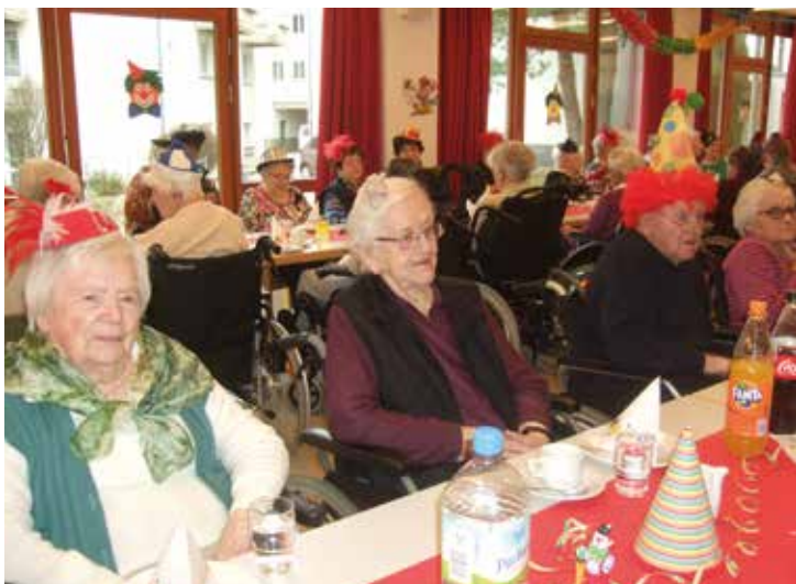
Die Gäste genossen das fröhliche Miteinander.

Weiter ging es am Fetten Donnerstag. Der Empfang der Körperlicher Möhnen war wieder ein Highlight und fiel wie immer herzlich und heiter aus. Abschluss und Höhepunkt der Session bildete traditionell der Karnevalsumzug am Fastnachtssamstag. Alle Närrinnen und Narren zog es nach draußen an die Straße um sich am bunten Treiben der Wagen und Fußgruppen zu erfreuen. Belohnt wurden die Zuschauer mit bester Stimmung und vielen Süßigkeiten.