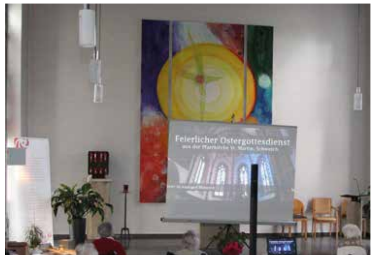
Gottesdienstübertragung via Internet

Er wollte damit allen Menschen Trost und Hoffnung spenden, aber auch den (gerade in Italien) massenweise verstorbenen Menschen, die keine Sterbesakramente empfangen konnten und können, den Ablass zeitlicher Sündenstrafen ermöglichen, der mit diesem päpstlichen Segen verbunden ist.