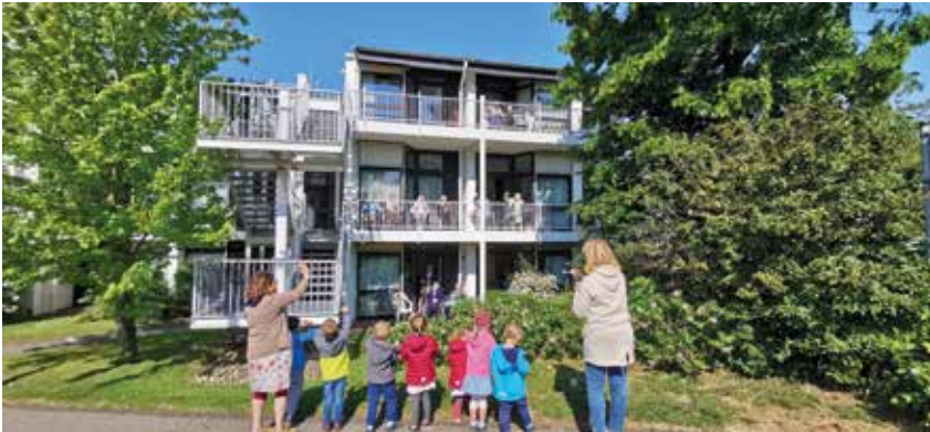
Kinder und Erzieherinnen vom benachbarten Kindergarten St. Martin Schweich unterhielten am 14. Mai Bewohner auf Terrassen und Balkonen