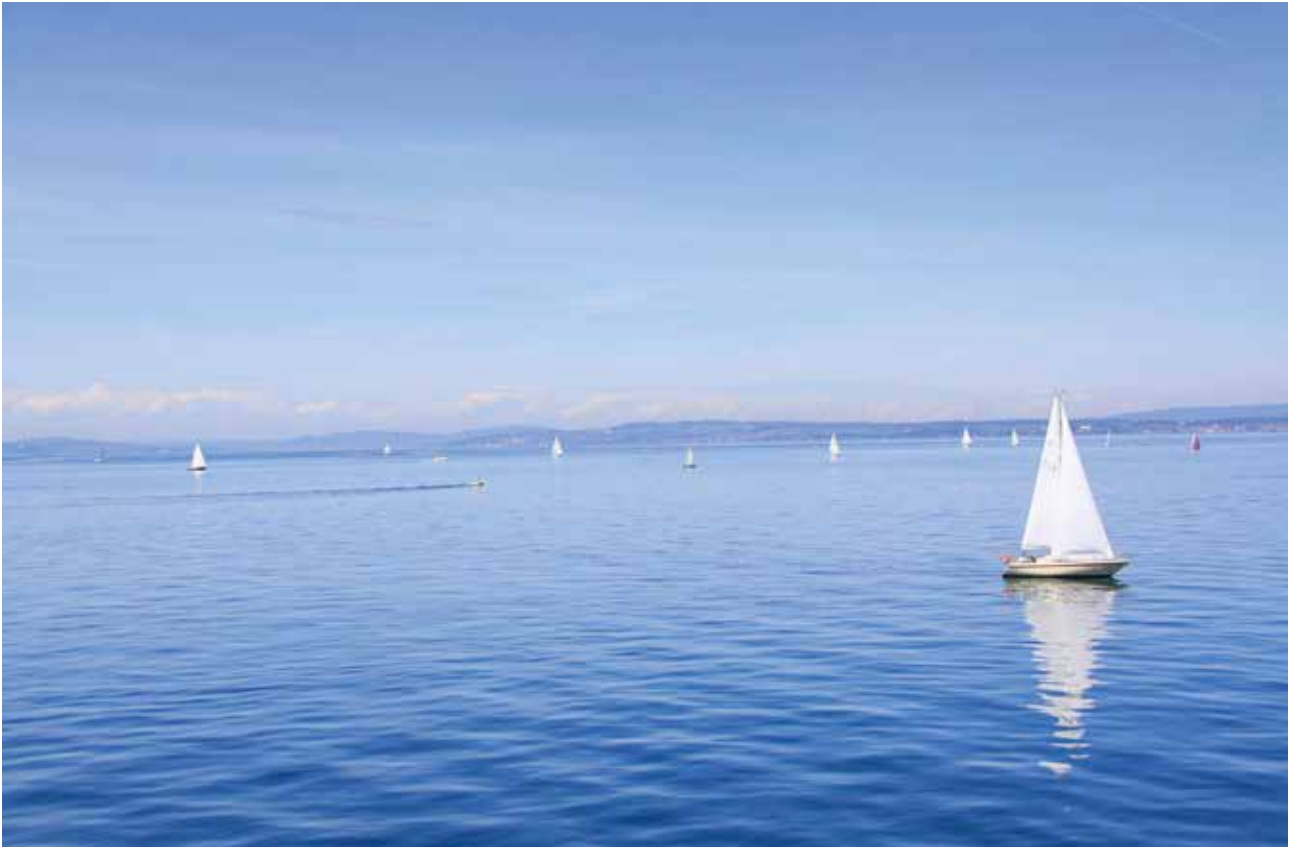
Blau steht für den Traum nach Freiheit, unendlichen Weiten aber auch für Introvertiertheit und den Rückzug in sich selbst.

ter diesem Eindruck möglichst viele Impulse zusammen zu tragen, die Ihnen in dieser Situation mithilfe des Geistes Gottes Trost und Hoffnung vermitteln können. In der Reihe unserer Regenbogenfarbenserie ist diesmal die Farbe Blau an der Reihe! Passt hervorragend! Blau ist die kühlsste, reinste und tiefste Farbe und steht für das Unbewusste, für seelische Tiefe und innere Stille. Blau ist die Farbe der Treue. Die Farbe Blau gilt auch für geistige Entwicklung, Spiritualität und der Sehnsucht nach einer immateriellen Welt. Im Christentum stand Blau als Farbe des Himmels schon immer mit dem Göttlichen, dem Überirdischen in Verbindung. Einst galt die Farbe als weiblich und wurde der Jungfrau Maria zugeschrieben. Im Gegensatz zum irdischen, präsenten Rot symbolisiert Blau das Irreale. Es steht gleichermaßen für den Traum nach Freiheit, unendlichen Weiten aber auch für Introvertiertheit und den Rückzug in sich selbst. Blau wirkt beruhigend und entspannend. Diese Farbe eignet sich optimal, um inneren und äußeren Frieden zu finden, um Stress und Hektik abzubauen. Blau löst nervös bedingte Verkrampfungen, die Muskeln lockern sich und das Herz