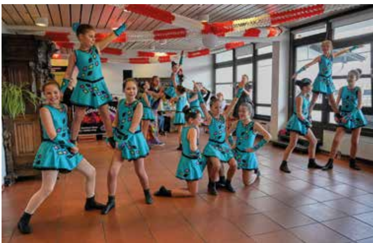
Die Funkemariechen der „Tanzmäuse Kid's“ vom TUS Eudenbach