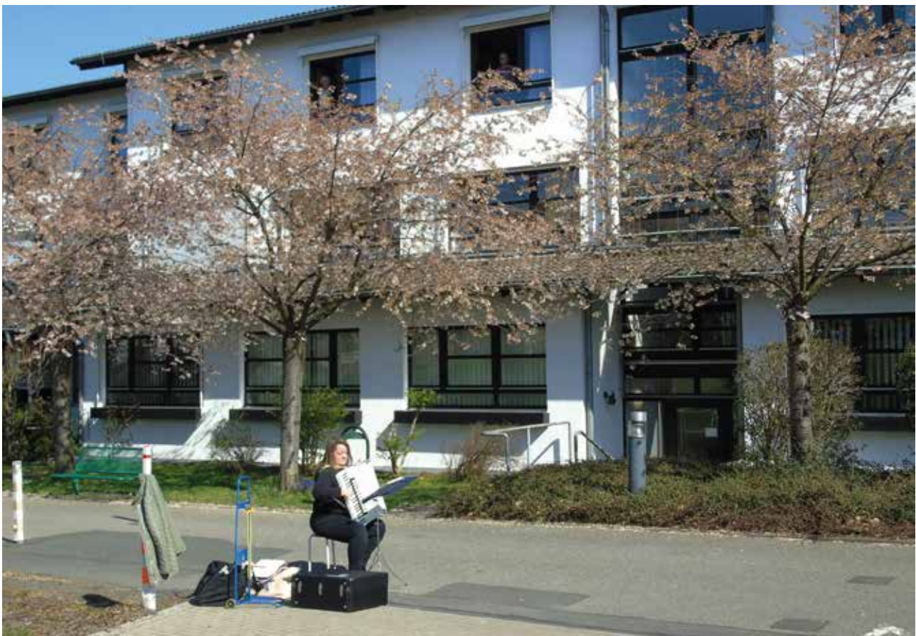
Maren Mallow beginnt auf Höhe des Haupteingangs und erreicht so auch die Balkone der Schwesterngemeinschaft.

Der fehlende soziale Kontakt zu Angehörigen und Besuchern ließ insbesondere die Quarantänitage für unsere Bewohner lang werden, obwohl unsere Mitarbeiter täglich weit über das dienstvertraglich Geschuldete hinaus ihr aller-