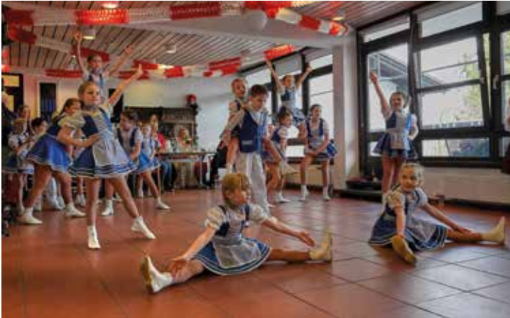
Die „Sternchen“ und die „Schnüppchen“ vom TC Sternschnuppen Bockeroth

Das Prinzenpaar bewältigte die majestätischen Aufgaben souverän und verteilte mit Unterstützung ihrer Adjutanten Blumen, Hausorden und Bützcher.