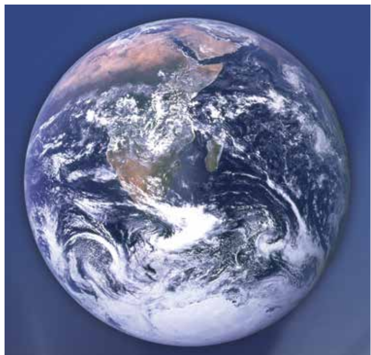
Blick aus dem Raumfahrzeug Apollo 17 auf die Erde (1972)

Liebe Leserinnen, liebe Leser, als wir in unserer Redaktionsgruppe die Themen für diese Ausgabe festgelegt haben, war das Corona-Virus zwar schon in der Welt, für uns alle damals aber noch sehr weit weg. Niemand konnte ahnen, wie dramatisch sich die Dinge entwickeln würden, und welche Auswirkungen das für den Alltag der Bewohner*innen und Mitarbeiter*innen in unseren Einrichtungen haben würde. Ich habe mich bemüht, un-