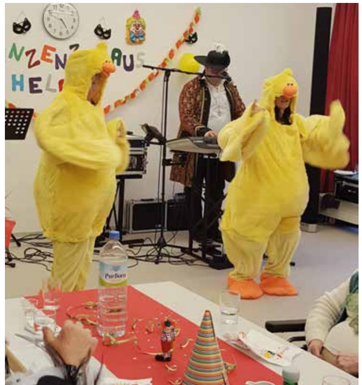
Zunächst tanzten nur zwei Enten, dann fanden weitere Narren den Weg zur Tanzfläche.

Viele weitere ehren- und hauptamtliche Kräfte unterhielten mit originellen Beiträgen. Alle Bewohner, Mitarbeiterinnen und Unterstützer von außerhalb genossen den fröhlichen Nachmittag, und so führte beim großen Finale mit dem „Ententanz“ kein Weg an einer Zugabe vorbei.