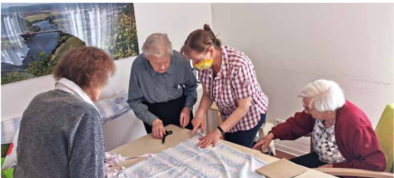
Mundschutzmasken nähen mit Demenzerkrankten

Es gab zu dieser besonderen Situation keine Vorwarnung, keine Schulung und demzufolge auch keinen Plan. Plötzlich breitet sich eine Epidemie aus und wir, die eigentlich die Aufgabe haben unsere Bewohner zu beschützen, werden womöglich zu einer Gefahr für sie. Eine enorme Zusatzbelastung und Sorge, mit der die Pflegenden unter diesen besonderen Bedingungen umgehen müssen. Es kommen Fragen auf, die keine direkte Antwort finden. Die Kommunika-