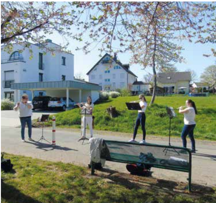
Flutelicious beginnt mit dem Spiel auf der Klosterstraße.

Für ein Straßen- und Balkonkonzert rund um das Franziskus Haus konnten wir am Karsamstag bei schönstem Sommerwetter vier Damen der Musikschule Bad Honnef begrüßen. Das Querflöten-Ensemble „Flutelicious“ besteht normalerweise aus bis zu 10 Mitgliedern. Es spielt überwiegend klassische Melodien aber auch Volkslieder. Für das Outdoor-Konzert hatte die Gruppe eine zauberhafte Mischung aus Frühlingsmelodien und klassischen Stücken