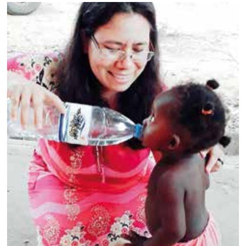
Sr. Voneide mit einem Kleinkind in Kangandala

Inzwischen gibt es 6 Niederlassungen der Franziskanerinnen v. hl. Josef. Das Haus in der Hauptstadt Luanda ist eine Anlaufstelle für Schwestern, die neu nach Angola kom-