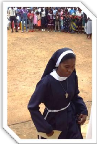
A Primeira Irmã Angolana de nossa Congregação a fazer os Votos Perpétuos