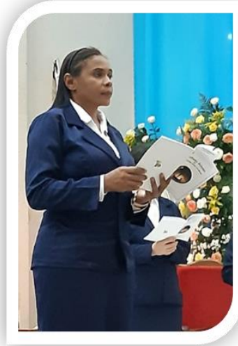
Como eu agradeço a tamanha graça que o Senhor me concedeu?

“Com a minha alma a transbordar de gratidão por essa escolha que só tu fazes de mim. A Ti me entrego para sempre, sem reservas aceitastes-me, Senhor aceitastes o meu SIM.” Quantos caminhos percorridos, quantos lugares eu andei, quantos noites escuras em profunda oração passei. Tua insistência depositou em mim um amor que edificou o meu nada no que hoje pra Ti sou: tua serva, amiga, irmã e esposa.